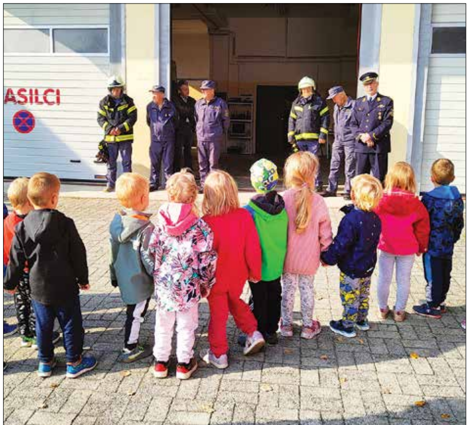
Spoznavanje osnov požarne varnosti

Organizirano vajo evakuacije izvajamo v vrtcu vsako leto, vendar na način, ki otroke čim manj vznemiri. Z evakuacijsko vajo navajamo otroke na pravilno reagiranje ob požaru, predvsem pa strokovni delavci vrtca obnovimo postopke odzivanja. Temo o požarni varnosti smo zaokrožili z obiskom gasilskega doma, kjer so nam gasilci razkazali gasilski dom, različne vrste gasilskih oblačil, gasilsko opremo in vozila.