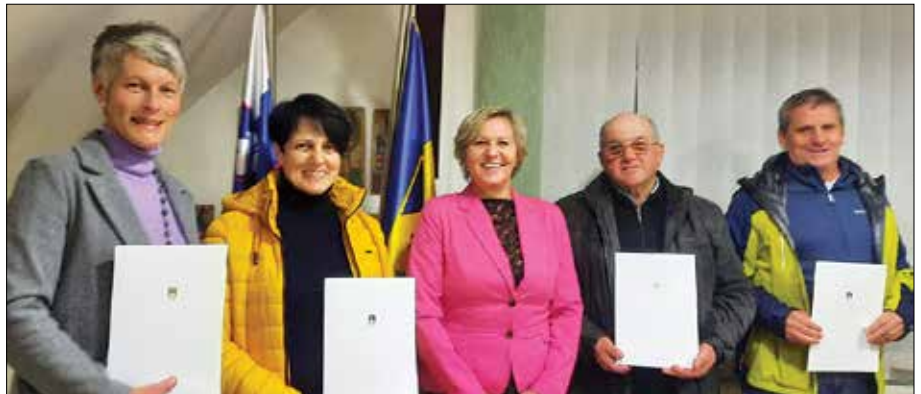
Prejemniki priznanj z županjo