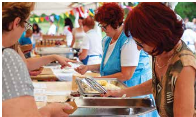
Štruklji zahtevajo skrbno pripravo.