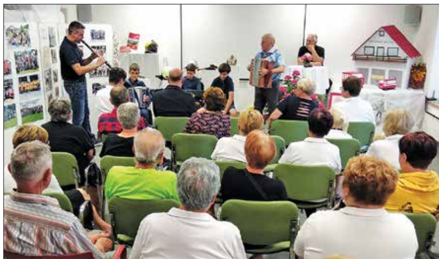
Gostili smo odprtja razstav KDLU Gal, Planinskega društva Rečica ob Savinji, razstavo ob 140-letnici PGD Rečica ob Savinji; navdušujejo pa nas tudi razstave, na katerih posamezniki predstavijo svoje delo.

Prostovoljci krajevnega odbora Rdečega križa naše občine poslanstvo opravljamo po ustaljenem ritmu. Obiskovanje občanov, majhne pozornosti, pomoč pri drobnih opravilih, delitev prehrabnih paketov. Le-teh je v tem letu malce manj, ker smo od države dobili manj. Spremljamo situacijo, vendar lahko poudarim, da se stanje ni spremenilo in zaenkrat nismo zasledili večjega odstopanja pri vlogah za pomoč.