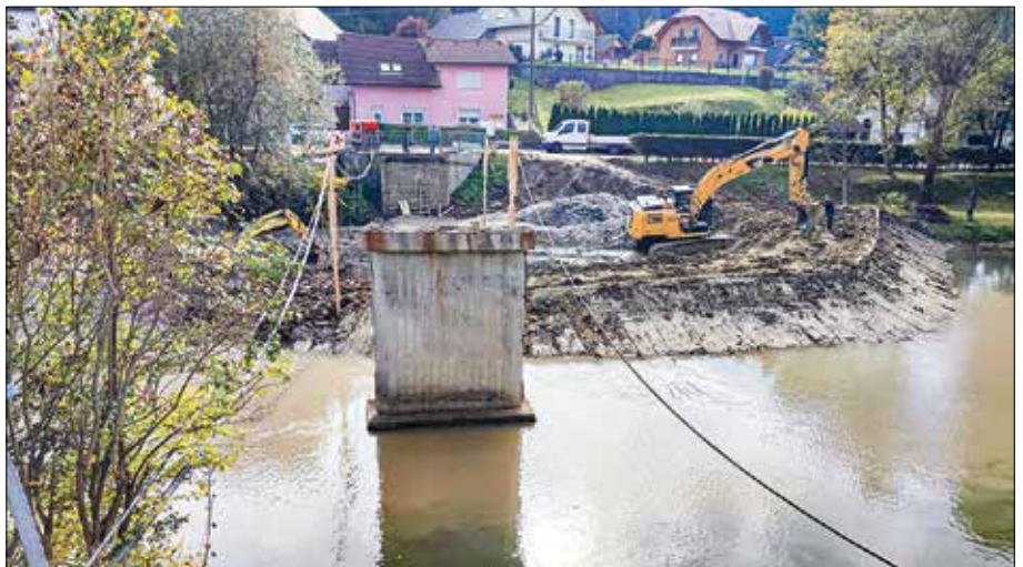
Gradnja mostu v Spodnji Rečici bo zaključena predvidoma junija prihodnje leto.