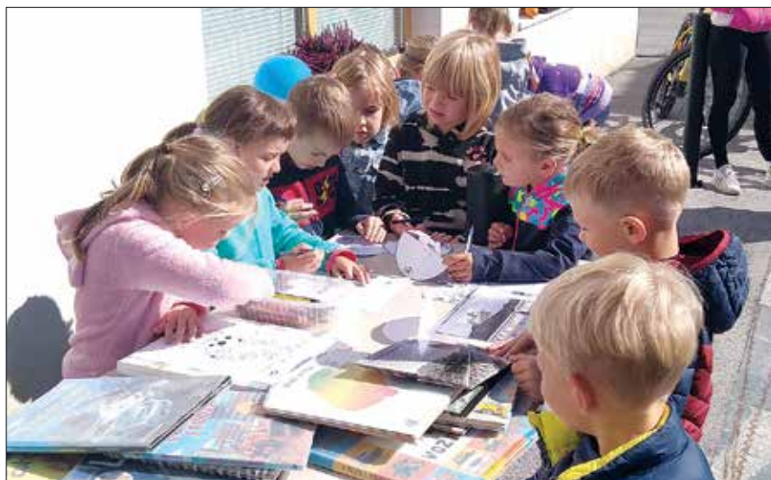
Skupaj z OŠ Rečica, Karitasom in Krajevno organizacijo RK smo zbirali pomoč za Ukrajino, v decembru se je v naših prostorih nabralo izjemno veliko daril v akciji Božiček za en dan, med letom pa smo izvajali projekt ETM.