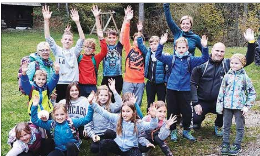
Super vikend na Farbanci

Poleg maratona smo v okviru občinskega praznika organizirali tudi prvenstvo v balinanju. Zmage sta se letos veselila domača člana iz sekcije Si-