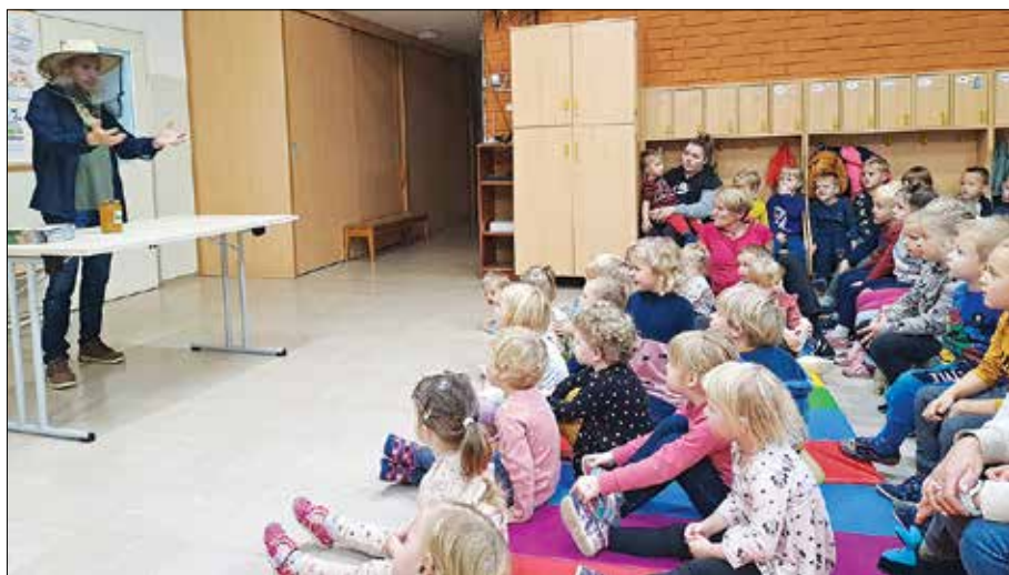
Otroci so z zanimanjem prisluhnili čebelarju.