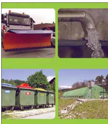
Poleg smeti v JP Komunala Mozirje skrbijo tudi za vodovod.