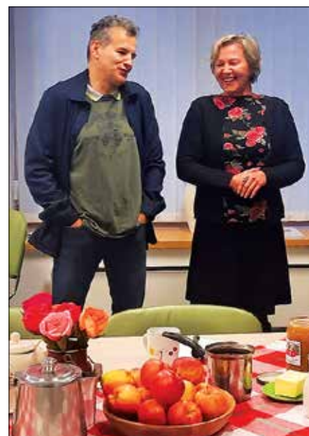
Medeni zajtrk z občinsko upravo in svetniki