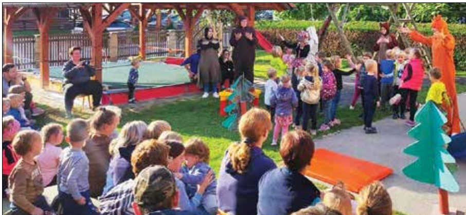
Pozdravili smo jesen.