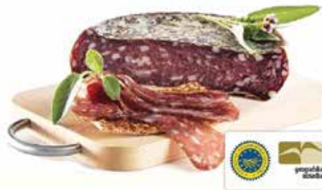
Želodec na promocijski razstavi, Brdo pri Lukovici, 16. november 2022