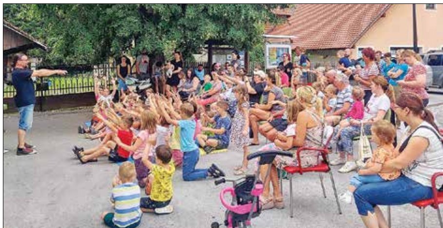
Čarovnik Grega je spet navdušil otroke.

Skozi celotno leto sta se zasedbi Rečiški pobi in Smooth band pripravljali