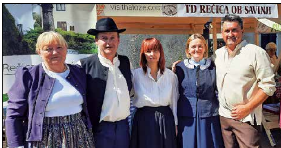
Pražnje urejeni predstavniki TD na Prangerijadi na Ptujski Gori.