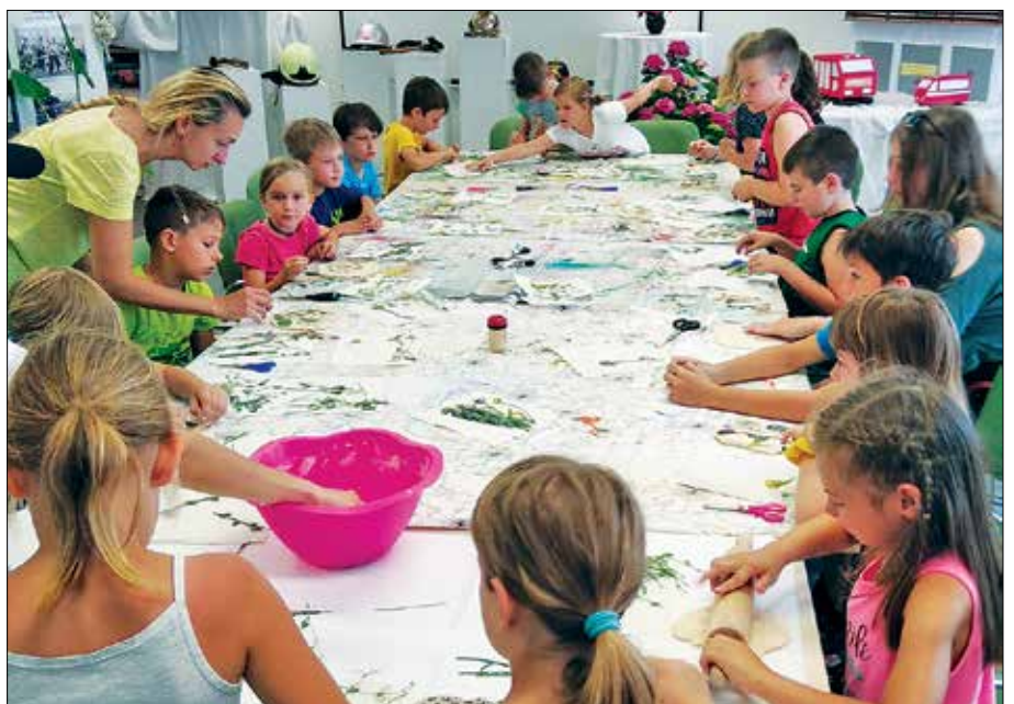
Med zimskimi, pomladnimi, poletnimi in jesenskimi počitnicami smo se z otroki zabavali, ustvarjali in rajali.