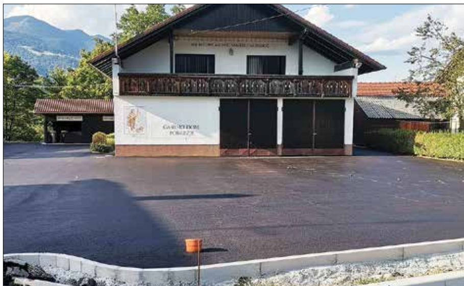
Zaključena prenova dvorišča

Dobrovo do naselja, kjer je velika in požarno nevarna lesno predelovalna dejavnost in vedno bolj prepoznavno vzletišče, je bila realizirana. V neposredni bližini vzletišča je bil postavljen nadzemni hidrant.