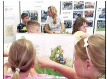
Srede so skozi celo leto rezervirane za pravljичno urico z ustvarjalnico, ki jo organizirata DPM in Osrednja knjižnica Mozirje.