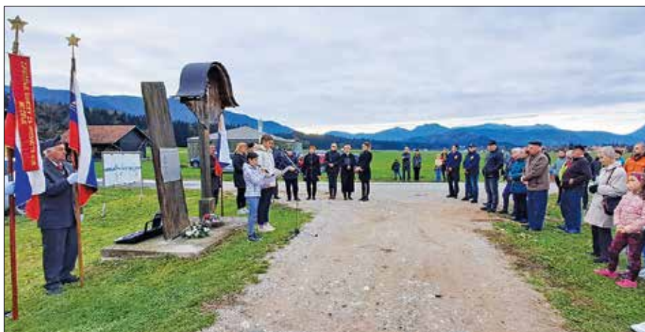
Spominska slovesnost ob pobreškem vzletišču