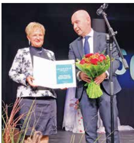
Čestitke ob jubileju

Največ pozornosti in priprav pa smo namenili praznovanju naše 60-letnice.