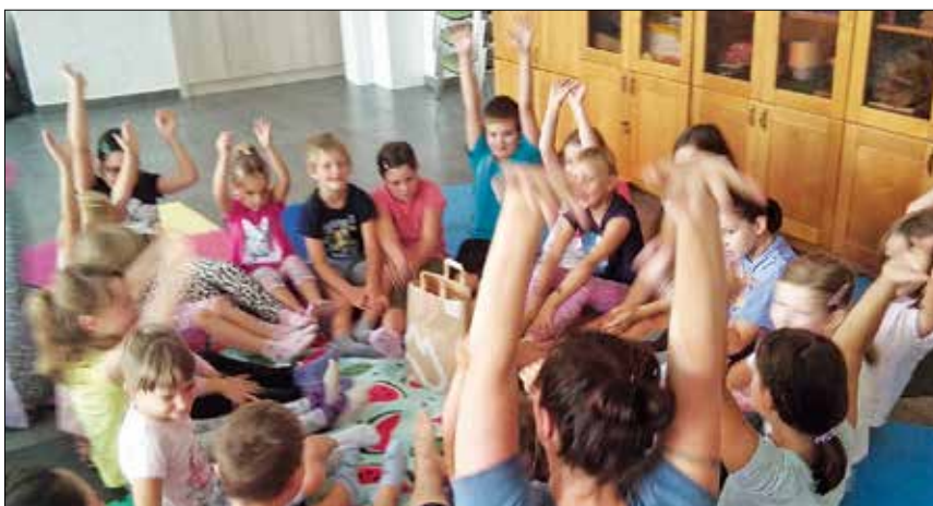
V Medgen borzi so se skozi celotno leto vrstila raznovrstna in pestra dogajanja, kot so potopisi, predstavitve knjig, predavanja o zdravju in zdravem načinu življenja, tečaji joge, pravljичne joge, joge za mamice z dojenčki, zvočne kopeli.