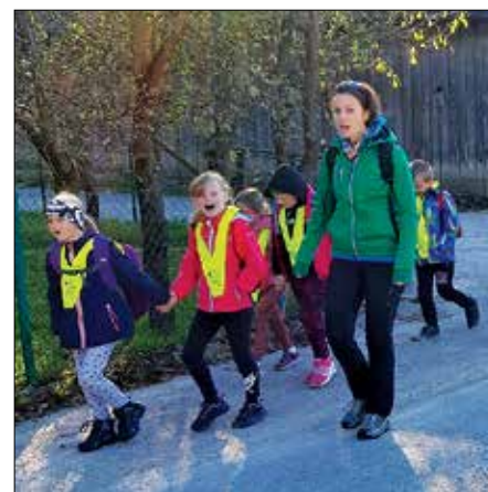
Stalnica našega dela so tudi organizirani pohodi za najmlajše.