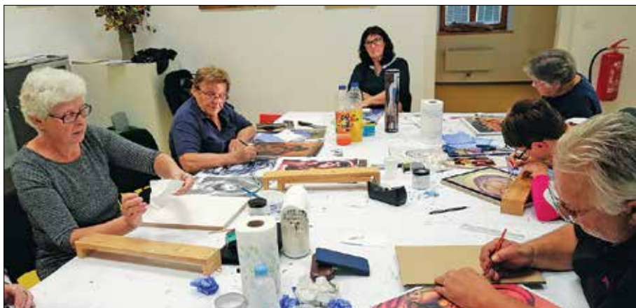
Galovci med ustvarjanjem

Včasih, res samo včasih, se mi zdi, da premalo razumemo, da je pot do polnega življenja društva, skupnosti, tako kot pot do resnice, dolga in vijugasta.