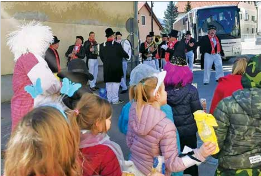
Februarja smo gostili šeme, ki jih je obiskal Pust Mozirski.

Uporabnik, ki potrebuje prevoz, pokliče brezplačno številko komunikacijskega centra 080 10 10, kjer bodo zabeležili njegove podatke in lokacijo prevoza. Po najavi prevoza bo klicni center obvestil prostovoljnega šoferja o prevozu in to sporočil uporabniku. Vabljeni k uporabi!