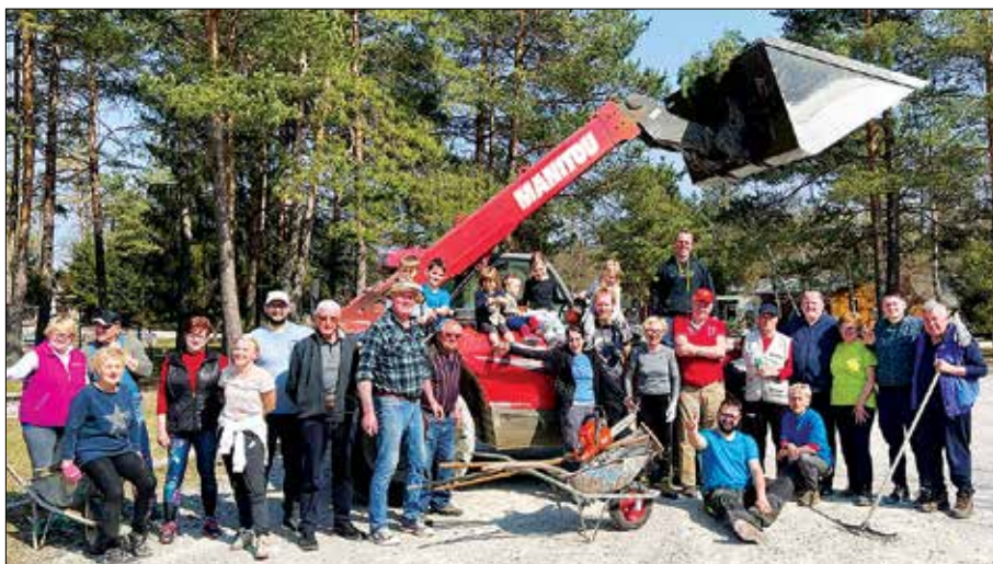
Delovni na delovni akciji

Seveda pa je v društvu pomemben tudi čas za druženje, o čemer pričajo tudi vsi naši dogodki, ki so izpeljani v okviru športnega društva. Tako smo organizirali že 9. zaporedni tradicionalni 24-urni maraton v odbojki na mivki. Udeležilo se ga je 35 tekmovalcev, ki so pokazali ogromno dobre igre in odličnega sodelovanja na vroči varpoljski mivki. Dogajanje na maratonu smo popestrili z velikimi napihljivimi igrali za vse naše najmlajše člane.