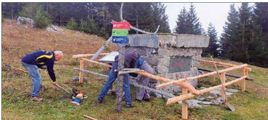
Obnova spomenika na Medvedjaku

vrha so lahke in lepo vzdrževane. Prav vsak lahko izkoristi vzpon za nabiranje kondicije, je pa pri tem še nagrajen.