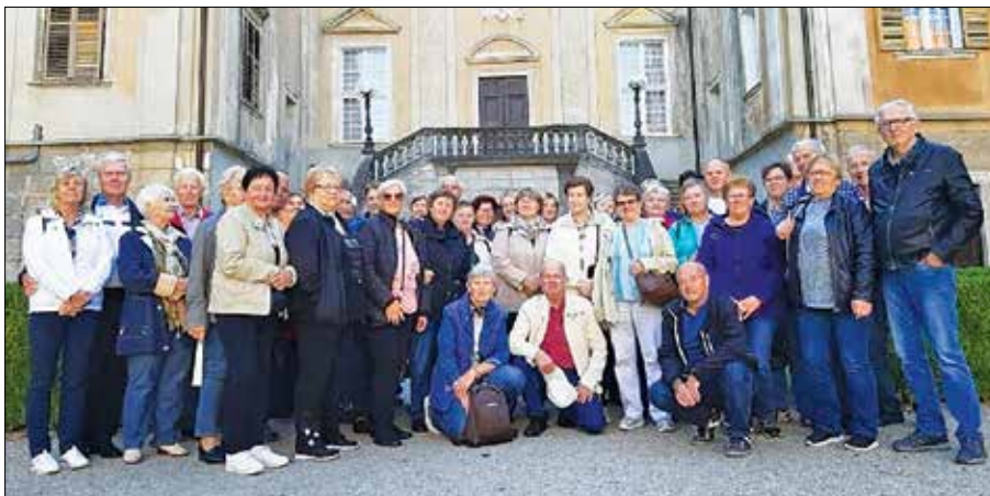
Upokojenci na enem od potepov

Želel bi pohvaliti vezilje, ki svoje izdelke razstavljajo doma in tudi na mednarodnih razstavah. V času občinskega praznika na Rečici ob Savinji z veseljem pokažejo izdelke, ki so nastali izpod njihovih pridnih rok. V času občinskega praznika Sivi panterji društva organizirajo tekmovanje v balinanju in so dobro organiziran tim. Člani projek-