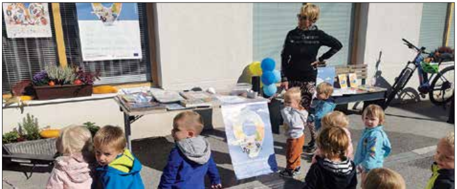
Vključili smo se tudi v Evropski teden mobilnosti.

Vpetost krajevne knjižnice v lokalno skupnost je velikega pomena za širjenje bralne kulture. Kot že nekaj let je naša krajevna knjižnica tudi v letošnjem juliju z veseljem sodelovala na prireditvi Rečica praznuje. Na njej so svoje delovanje v občini predstavila številna društva in zavodi, med njimi tudi Osrednja knjižnica Mozirje. Na naši stojnici so obiskovalci prejeli vse informacije o delu in storitvah, ki jih ponuja knjižnica. V septembru smo sodelovali tudi na prireditvi Dan brez avtomobila. Dogodek je v okviru Evropskega tedna mobilnosti organizirala Občina Rečica ob Savinji, knjižnica pa se je pridružila dogajanju pred prostorom Medgen borze