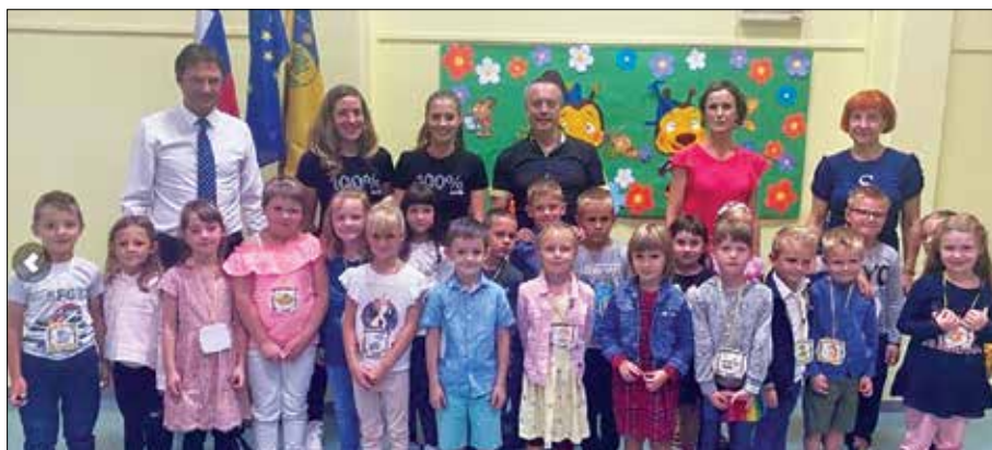
Pozdrav za prvi šolski dan