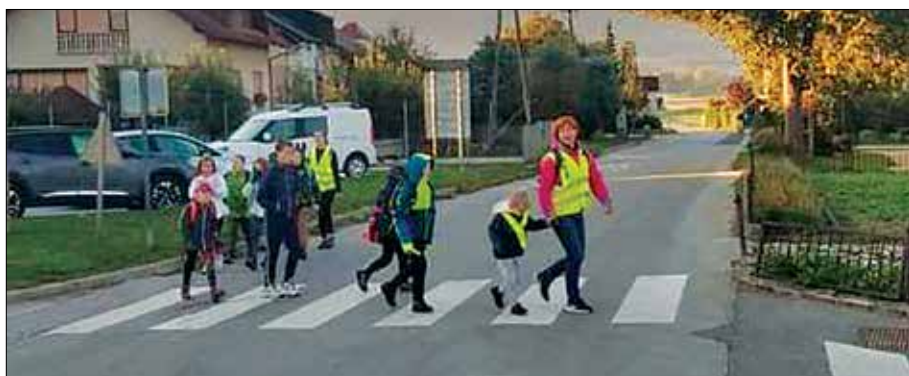
V okviru ETM so učenci hodili peš v šolo.