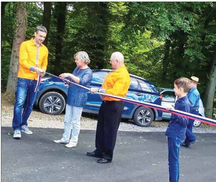
Slavnostno rezanje traku

»Cesta Canger–Mesničar je v celotnem koncesijskem sklopu edina, ki je asfaltirana na novo, pri vseh ostalih gre za zamenjavo oz. obnovo obstoječe asfaltne prevleke, zato je po izvedbi tudi sprememba najbolj očitna in veselje toliko večje. Živimo v letu 2022 in venomer poudarjam, da v teh, t. i. sodobnih časih