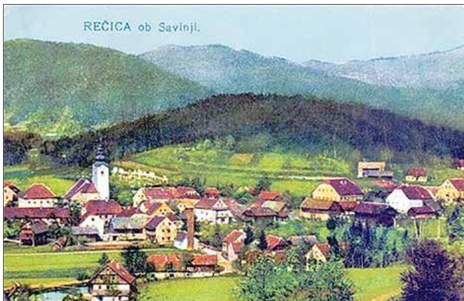
Rečica z okolico. Razglednica, odposlana 1918, retuširana (avtor FKG).

GORICE – gozdat greben med Pobrežjem in Zadretjem – podaljšek Homa na vzhodu. Nekdaj so tam lončarji kopali kakovostno glino za izdelovanje lončne posode (kokarski piskrci).