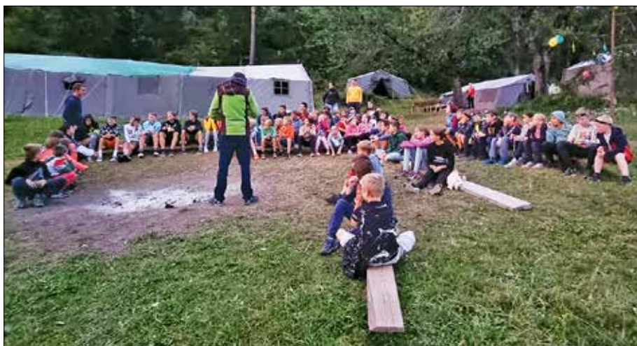
Prizor s Tabora mladih planincev

Nagradili smo prve tri, ki so se največkrat vpisali v vpisno knjigo na najvišjem vrhu občine, Medvedjaku. Tudi v letošnjem letu se akcija nadaljuje, razdeljene bodo lepe praktične nagrade. Poti do