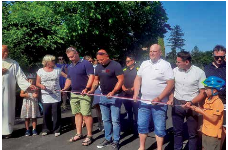
Na Pobrežju so odpirali t. i. odseka 2 in 3.