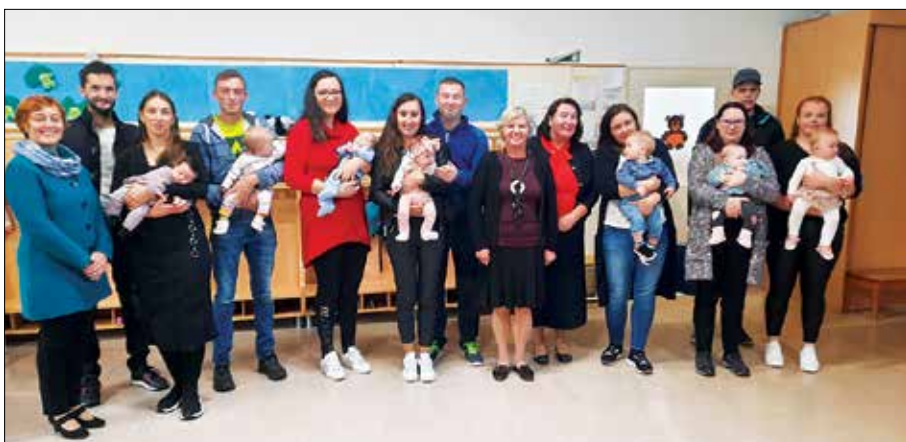
Malčki prvič v prostorih vrtca