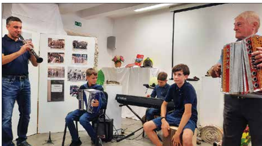
Trije rodovi Atelškovih so obogatili program ob odprtju gasilske razstave.

Izjemno delovni smo bili prvo juljsko soboto, ko smo organizirali prireditev Rečica praznuje s predstavitev društev in institucij. Popoldansko doga-