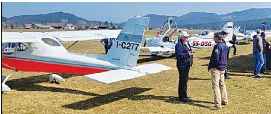
Živahno dogajanje na pobeškem vzletišču

Prvo soboto v juniju so si nebo nad Rečico lastili padalci. Vsakdo, ki je zbral dovolj poguma, je lahko izkusil skok v tandemu z višine 4000 m. Letalo Pylatus Porter ter inštruktorje padalce je za-