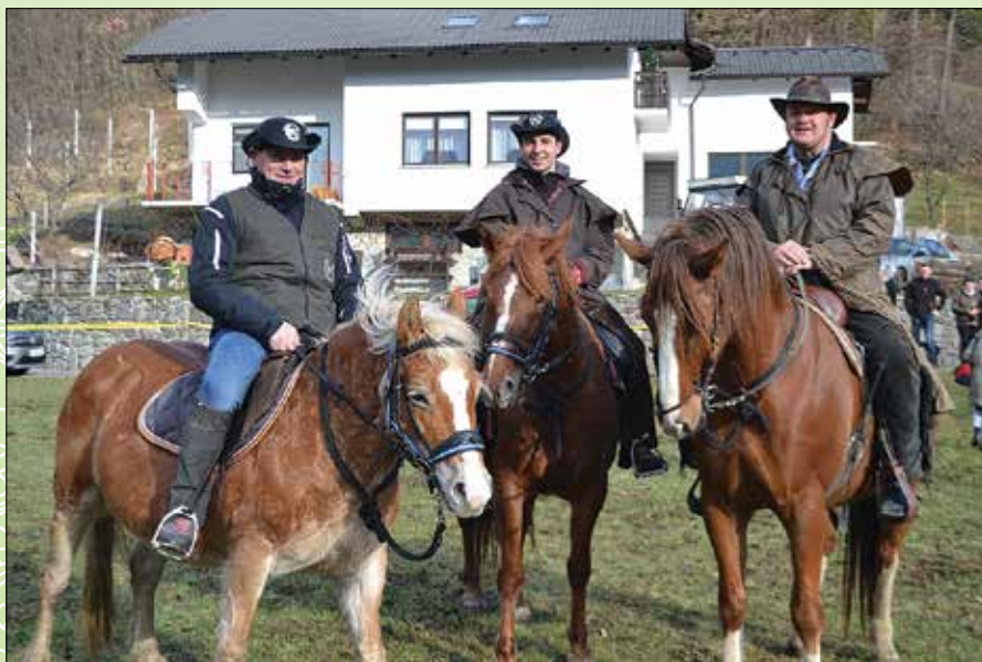
Na hrbtih plemenitih živali