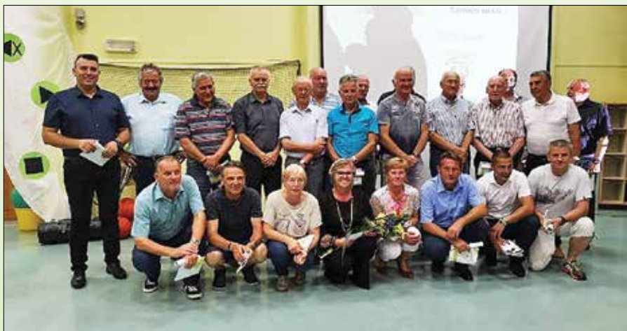
Športni zanesenjaki so proslavili pol stoletja delovanja društva.