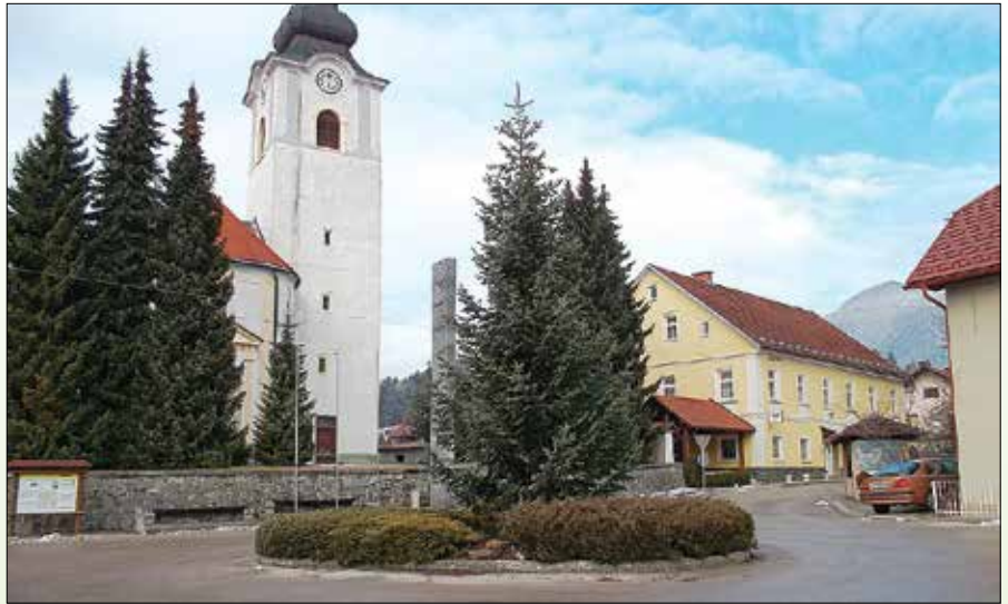
Trg pred obnovo

Izvedeno je bilo podaljšanje sanacije ceste, vodovoda, javne razsvetljave in kanalizacije za 30 metrov. Razlog za podaljšanje je novo mesto elektro napajanja celotnega območja naselja Rečice, ki je predvideno v TP pri sušilnici. Elektro Celje mora ta del ceste prekopati za priključitev elektrovoda. Nekaj denarja se bo porabilo še za obnovo NOB spomenika ter pripravo dokumentacije za postavitev spomenika NOB na novo lokacijo pri pokopališču.