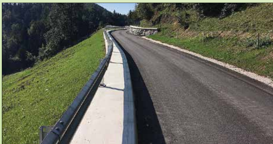
Cesta po končani sanaciji

V območju hudourniške grape se je izvedla manjša kamnito-betonska pregrada v dolžini 18 metrov in višini 5 metrov, nato pa do prepusta kamnito-betonsko korito. V hudourniškem koritu je izveden kaskadni prag. Celotno območje plazine se je v končni fazi poravnalo, humuziralo in zatravilo. Na območju posega se je cesta celovito rekonstruirala.