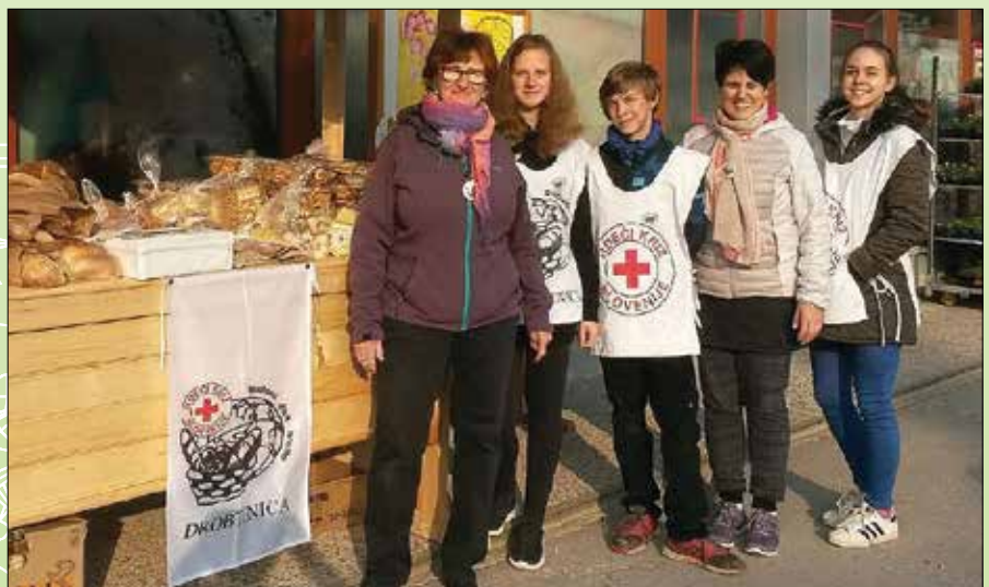
Rečiški prostovoljci RK na letošnji Drobtinici

Pomagamo jim v materialni obliki - letos smo razdelili 354 prehrambnih paketov, 1062 kg pralnega praška in nekaj manj kot 15 ton ostale hrane (mleko, moka, testenine, olje, riž, konzerve) v skupni vrednosti okoli 26.000 evrov. Pri plačilu položnic smo pomagali v višini okoli 3.000 evrov. Na brezplačno letovanje na Debeli rtič smo poslali 28 otrok in 4 starostnike, 140