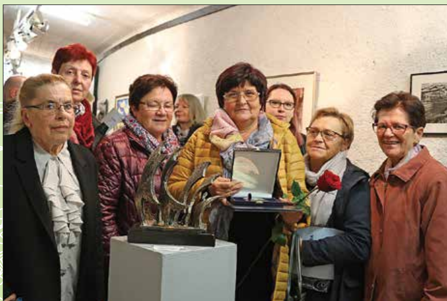
Na zaključku Zlate palete

stavlamo na samostojnih razstavah ali sodelujemo v okviru širših postavitvev. Tako smo sodelovali na razstavah na Rečici ob Savinji – Osnovna šola, v Gornjem Gradu – galerija Štekl, v Velenju – na gradu, v Trbovljah – galerija