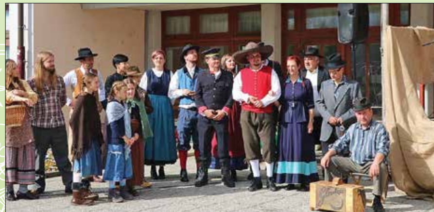
Turistično društvo Rečica ob Savinji je ob pomoči LAS-a s projektom Lenartov sejem s pripadajočimi aktivnostmi uspešno sodelovalo na Festivalu okusov in tradicije.

racije je vodilni partner LAS poslal v potrditev pristojnim organom, to je Agencija RS za kmetijske trge in razvoj podeželja za sklad EKSRP in Ministrstvu za gospodarski razvoj in tehnologijo za sklad ESRR. Nekaj odločb o potrditvi le-teh operacij smo že prejeli, preostale pa so v postopku odobritve.