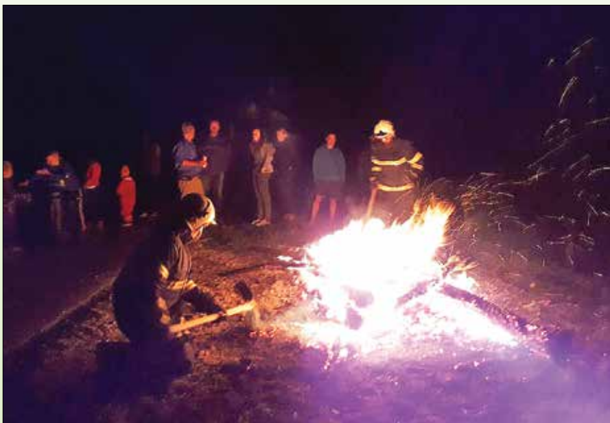
Na letošnjem kresovanju v Borseki so požarno stražo opravljali člani PGD Pobrežje.