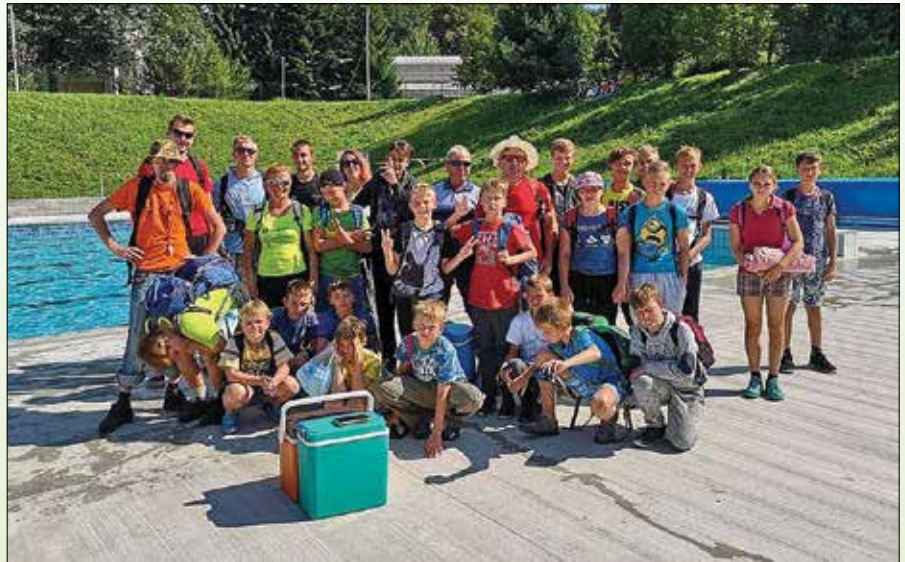
Raznolike aktivnosti mladih planincev

ža Zvira in letos z Gasilskim društvom Pobrežje. Za učence osnovne šole in varovance vrtca pa organiziramo pohod po mejah občine in pohod na Kuglo. Lepo in prav je, da se spoznavaajo kraji v občini, pogrešamo pa večje število starejših udeležencev. Na Ku-