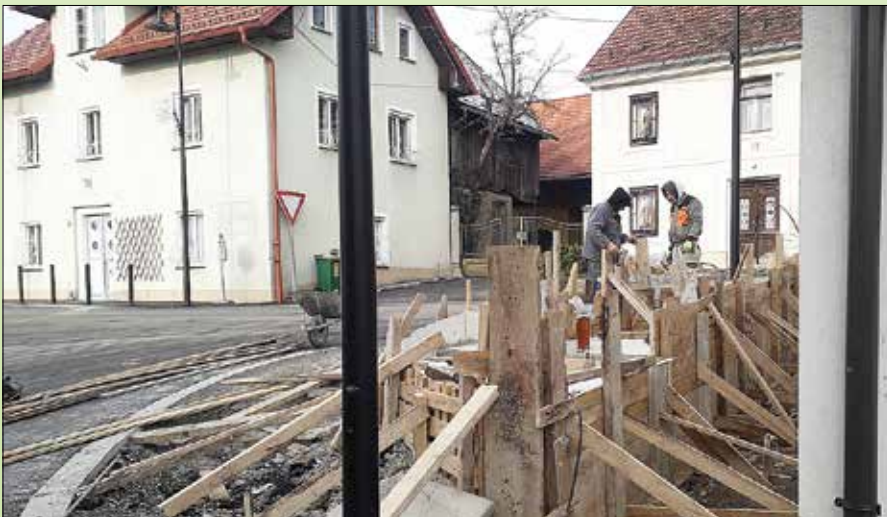
Pripravljalna dela za postavitev prangerja