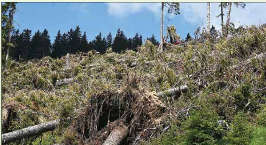
Podobe, ki jih za sabo pušča hud veter.