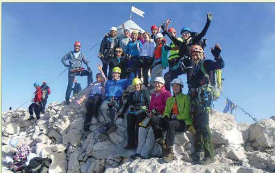
Člani PD smo osvojili številne vrhove.

rili čim večjemu številu otrok. Vsak tabor je nekaj posebnega, enkratnega in čudovitega, letošnji je bil sigurno eden izmed teh. Upam in želim si, da se naslednje leto spet zberemo v še večjem številu, tabor naj bi bil Čez Sočo; preživimo nepozaben teden med igro, hojo po naših skalnatih pobočjih in doživimo kak nepozaben utrinek ali eno od svojih prvih ljubezni. Izvedbo letošnjega tabora so nam omogočili tudi sponzorji, ki so prispevali denarna sredstva