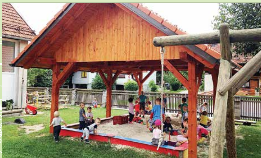
Razveselili smo se nadstreška, ki nas ščiti pred dežjem in soncem.