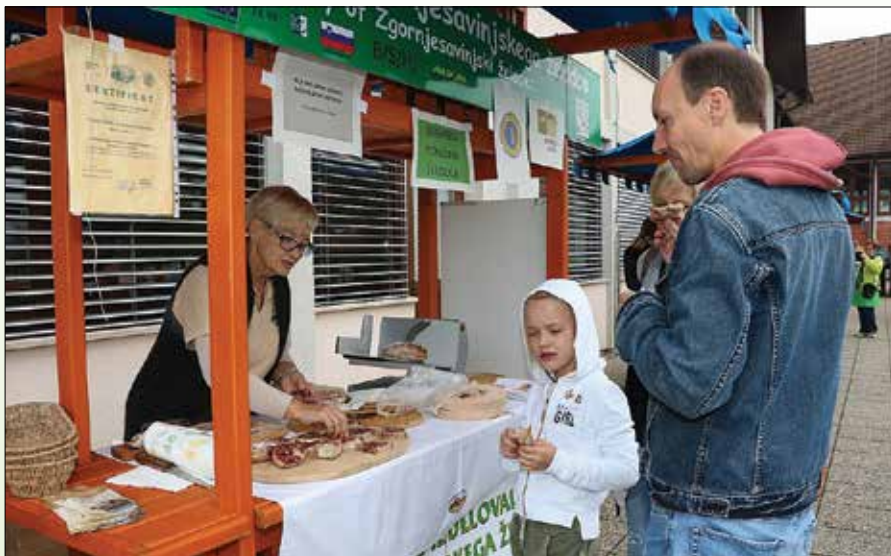
Člani združenja smo sodelovali tudi na Lenartovem sejmu.

mi na tematiko izdelave želodca in z zaključno degustacijo na Lenartovem sejmu.