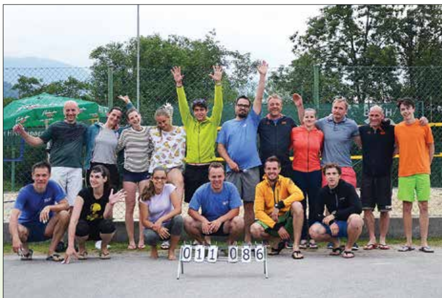
Maratonci so v odbojki »tekli« že peti krog.

V mesecu juniju smo se aktivno vključili v praznovanje občinskega praznika in organizirali odprto prvenstvo občine Rečica ob Savinji v balinanju, domači ljubitelji odbojke na mivki pa so v družbi skupine rekreativcev iz Maribora uspešno odigrali svoj peti 24-urni maraton.