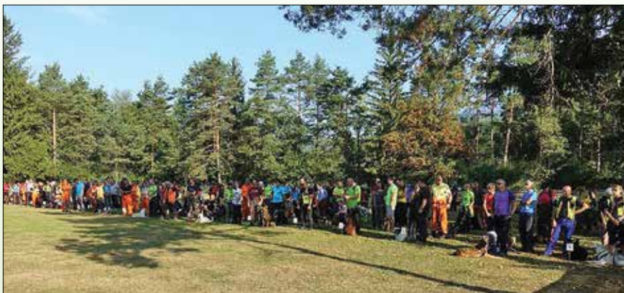
Gostje so bili z organizacijo tabora zelo zadovoljni.