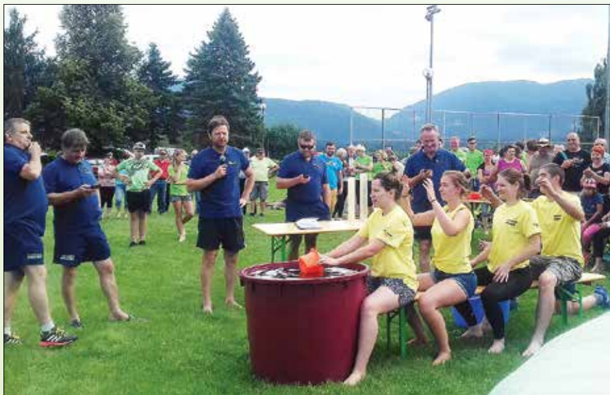
Tudi na letošnjih Igrah med naselji ni manjkalo smeha in dobre volje.

nja zgornjesavinjskega želodca. Izvedena so bila 3 predavanja: Skrivnosti izdelave kvalitetnega želodca, Zorenje in sušenje želodca ter Senzorične lastnosti kakovostnega želodca. Na domačiji Petek smo, prav tako v sodelovanju z Združenjem, pripravili ogled dobre prakse za udeležence z območja LAS ZŠSD in LAS Notranjska.