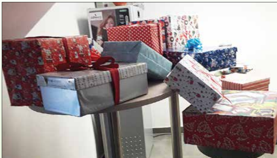
Darila, zbrana v akciji Božiček za en dan, smo morali kar dvakrat peljati na zbirna mesta.