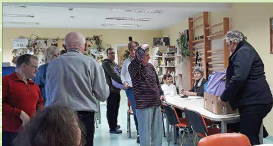
Za darila je poskrbelo turistično društvo.