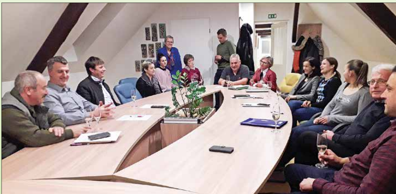
Po zaključnem uradnem delu prve seje

Pod rečiškim zvonom Izdajatelj: Občina Rečica ob Savinji, Rečica ob Savinji 55, 3332 Rečica ob Savinji, tel. 83 91 830. Odgovorna urednica: Urška Selišnik. Lektorirala: Polonca Kolenc Ozimic. Računalniški prelom in priprava za tisk: Savinjske novice, d.o.o., Nazarje, Savinjska cesta 4, 3331 Nazarje. Tisk: Grafika Gracer, d.o.o., Lava 7b, 3000 Celje. Naklada: 850 izvodov. Glasilo Pod rečiškim zvonom izhaja najmanj enkrat letno in ga prejmejo vsa gospodinjstva v občini Rečica ob Savinji brezplačno.