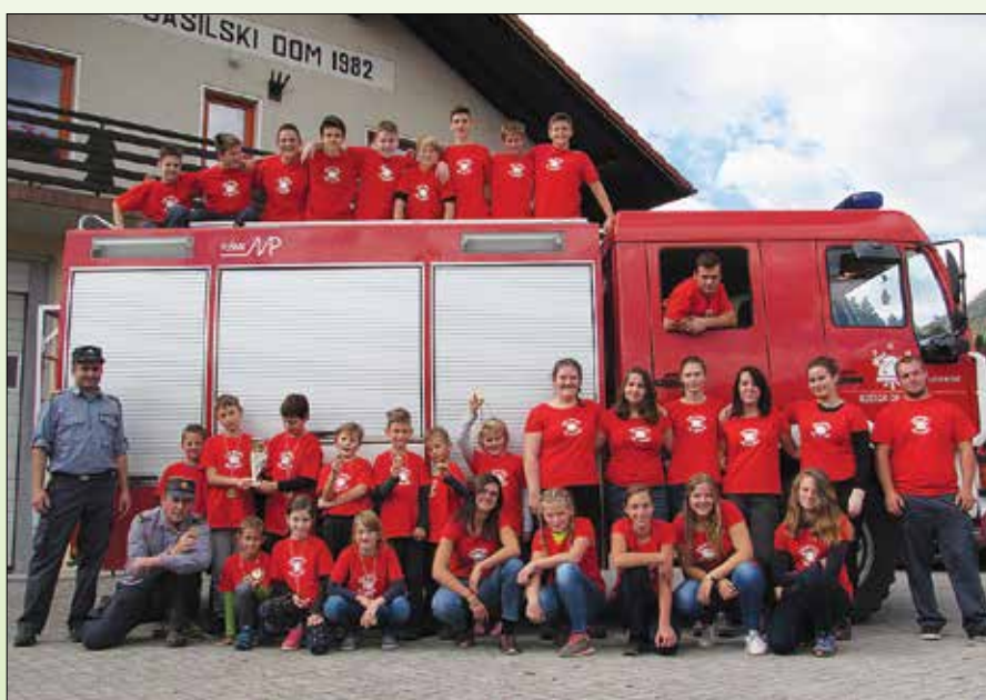
Mladi v naših vrstah

tekmovanja v Gornji Radgoni, na katero so se uvrstile štiri naše enote, ki so v lanskem letu premagale konkurenco na nivoju GZ ZSD ter na nivoju Savinjsko-Šaleške regije. Pionirji, članice A, člani A in člani B so dosegli dobre rezultate in ponesli ime Rečica ob Savinji tudi v severovzhodni del Slovenije. Še posebej smo ponosni na našo enoto pionirjev, otroke stare od 6 do 11 let, ki so tekmovali v vaji z vedrovko, štafeto s prenosom vode in v vaji razvrščanja. Med 54 najboljšimi enotami iz cele Slo-