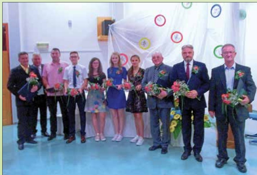
Letošnji nagrajenci Občine Rečica ob Savinji