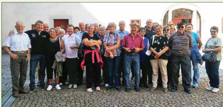
Na enem od naših druženj

Posebej moram pohvaliti sekcijo vezilj pri DU, ki svoje izdelke razstavljajo na mednarodnih razstavah in v času občinskega praznika v prostorih OŠ Rečica ob Savinji z veseljem pokažejo izdelke, ki so nastali izpod njihovih pridnih rok. V času občinskega praznika pa tudi Sivi