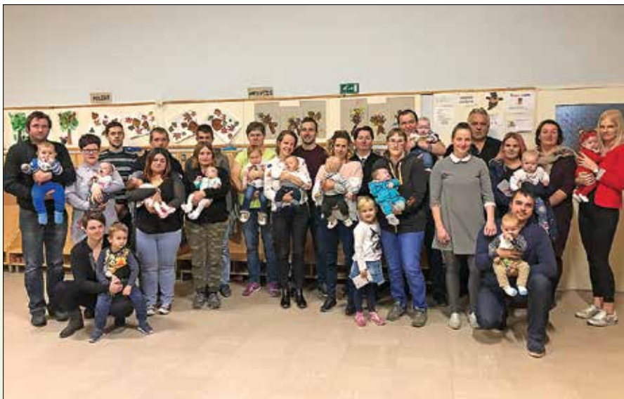
Radosti mladih družin