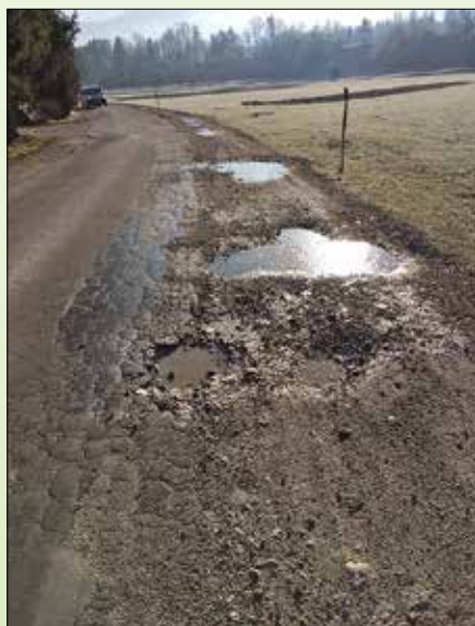
Lokalna cesta pred sanacijo

Saniran je bil odsek ceste v skupni dolžini 400 metrov. Sanirana je bila celotna voziščna konstrukcija vključno z asfaltno podlago. Dograjena in obnovljena je bila javna razsvetljava. Obnovljen je bil ekološki otok in izdelana priprava za avtobusno postajališče, hiško so postavili in financirali krajanji sami.