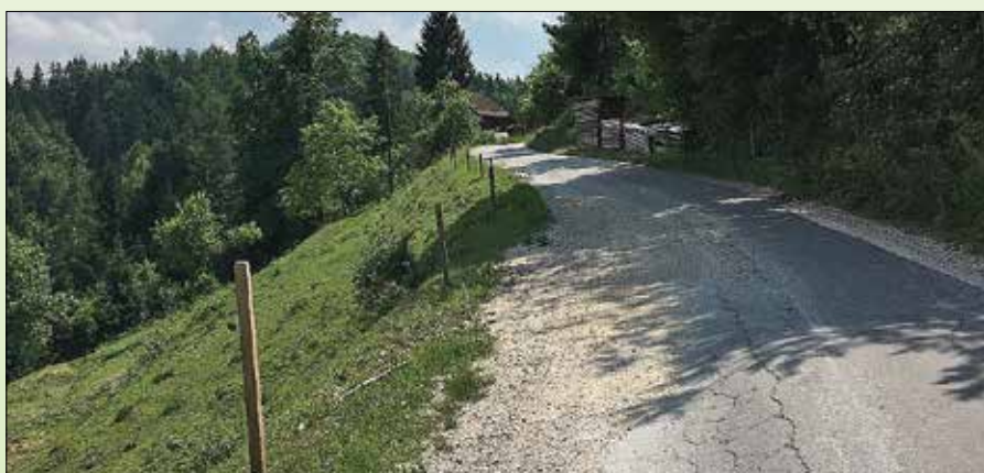
Cesta pred sanacijo

Občina Rečica ob Savinji je za predmetni projekt pridobila 168.302 evrov nepovratnih sredstev s strani Ministrstva za okolje in prostor. Dela so bila končana septembra 2018. Izvedena so bila na-