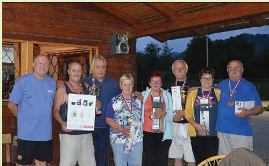
Baliranje – dobitniki priznanj z županom in predstavnikom organizatorja.

Da pa občinski praznik ni bil le športno obarvan, smo poskrbeli še za tradicionalno, slastno pokušino domačih suhomesnatih specialitet v režiji društvenih »želocmojstrov«.