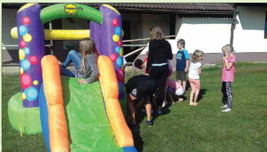
S pomočjo otrok smo postavili tudi tobogan.

z našimi aktivnostmi v večji meri zelo zadovoljni. Dogodki so popolnoma ali v celoti uresničili pričakovanja obiskovalcev, ki so naše delo ocenili s 6,17 od 7 možnih točk. Vprašani so bili naj-