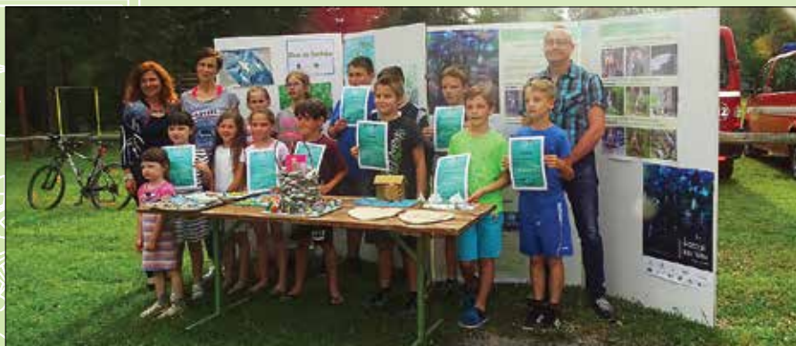
Največ priznanj na likovnem natečaju so prejeli učenci OŠ Rečica ob Savinji.