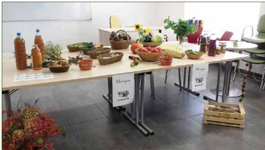
Med različnimi aktivnostmi je bila tudi organizacija Zelemenjave.

V okviru aktivnosti Varstvo otrok smo izvedli prijavljene počitniški aktivnosti: Počitniški februar, Prvomajska potepanja, Skok v počitnice in Živ žav počitnice, v decembru pa nas čaka še Pravljična Rečica. Prijazno vabljeni!