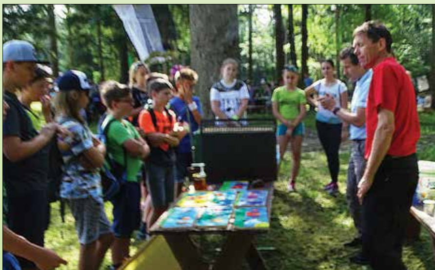
Sodelovanje na Dnevu za Savinjo