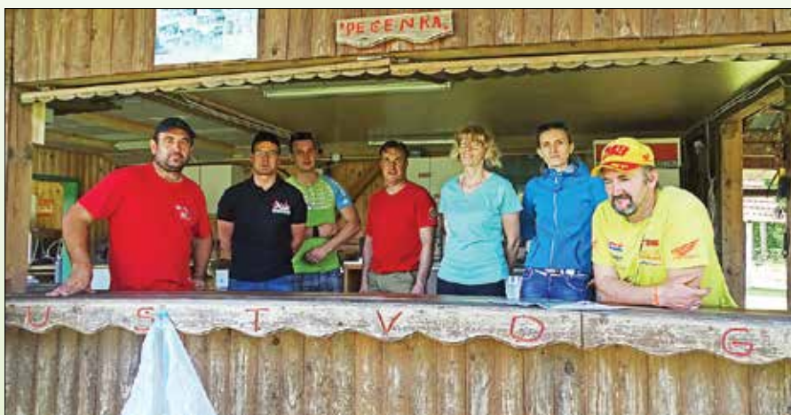
Dan za Savinjo je za PGD Grušovlje minil zelo delovno.