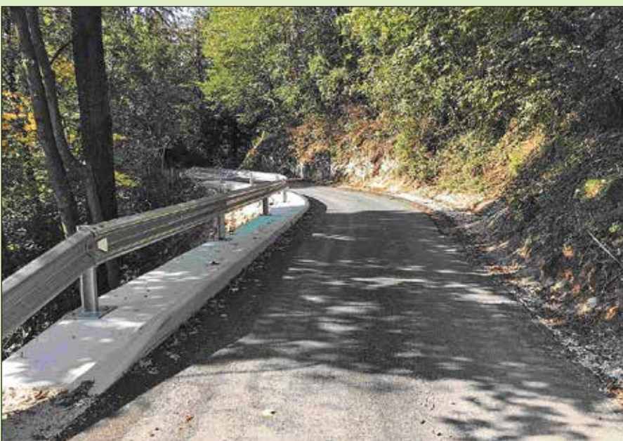
... in potem