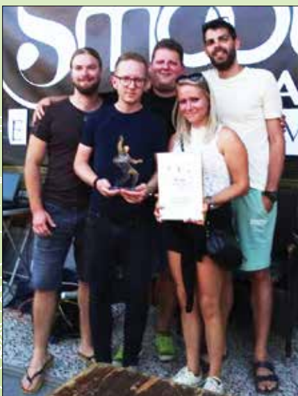
Sprejem za »elvisov« Smooth Band