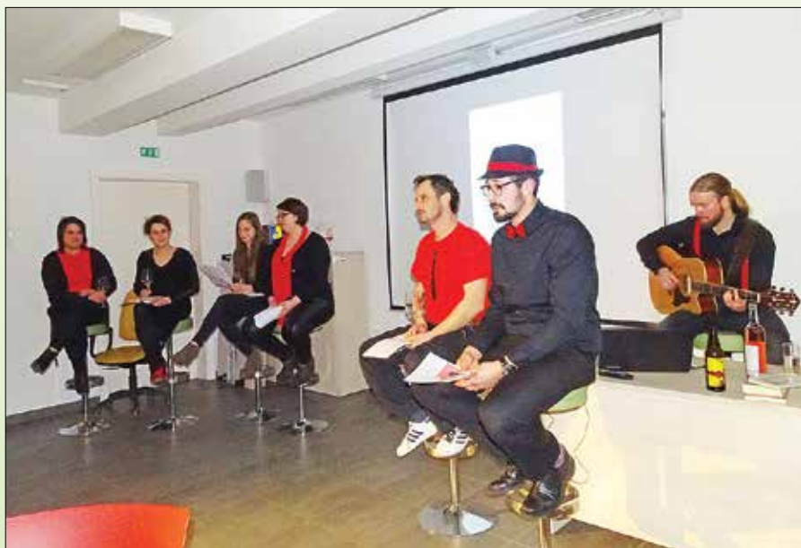
Poezija na Gregorjevem večeru