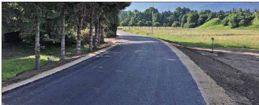
Sanirani cestni odsek lokalne ceste

Na desnem bregu (Homec) je bil izveden 350-metrski odsek vodovoda in novi AB jašek, ki služi za razbremenitev tlakov. Preboj Savinje je bil izveden z vodeno vrtino po HDD metodi v skupni dolžini 140 m (cev PE100 DN110 mm, PN16, OPLAŠČENA). Na levem bregu