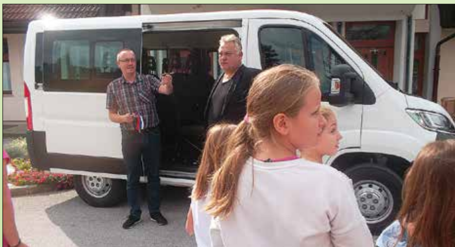
Učenci so z bogatim programom pokazali, da se veselijo nove pridobitve.