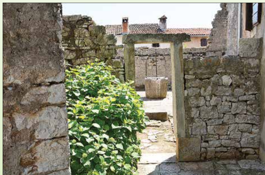
Utrinek s potepanja po Istri.

Še kako sem prepričan, da je vredno vztrajati na poti, ki smo jo pred leti trsiral skupaj s strokovnim svetom društva. Povabil bi vsakogar, ki smatra, da