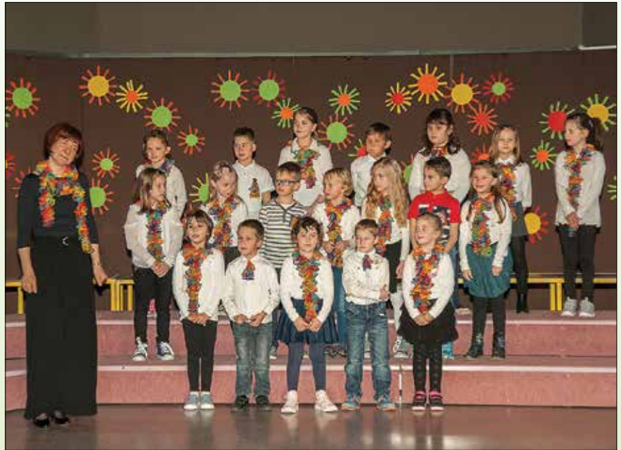
Mlajši OPZ Rečica ob Savinji (»CICIDO, območna revija OPZ in MPZ«)

9 različnih pevskih sestavov. Tudi letos so na srečanju otroških pevskih zborov vrtcev »PIKAPOLONČEK« svoj talent pokazali naši najmlajši, kjer je sodelovalo 6 zborčkov iz vrtcev Zgornje Savinjske doline.