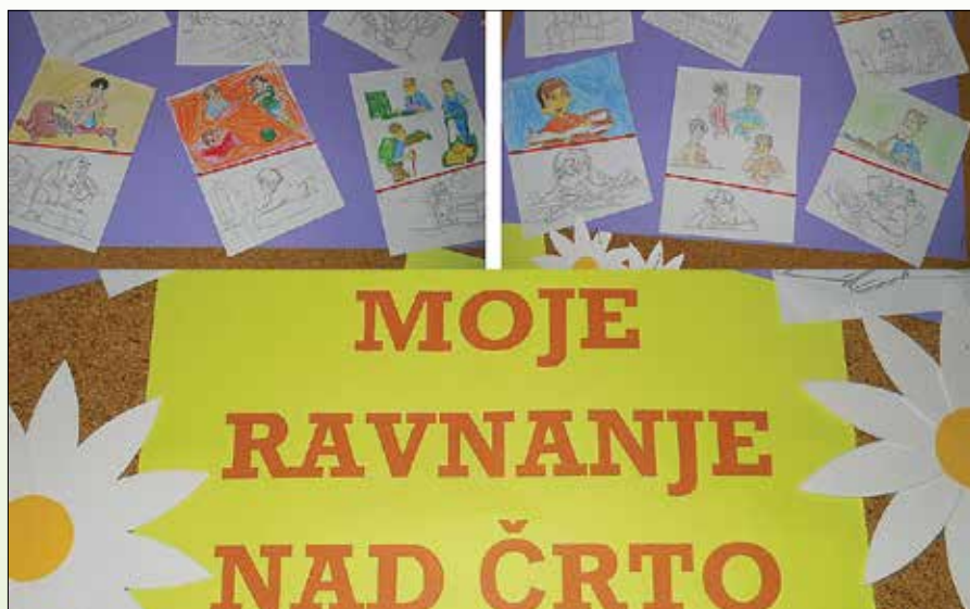
Črta odgovornosti – 1. razred