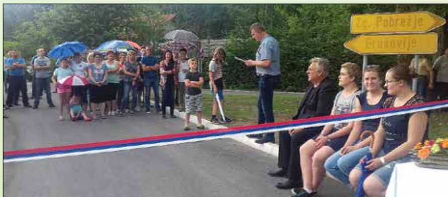
Domačini so s prisrčno otvoritvijo proslavili novo naložbo.