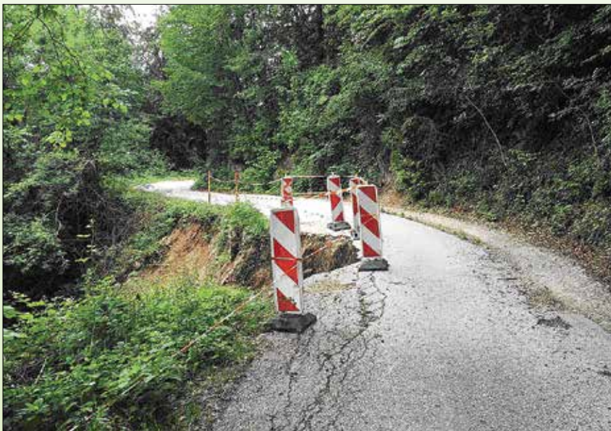
Cesta prej ...