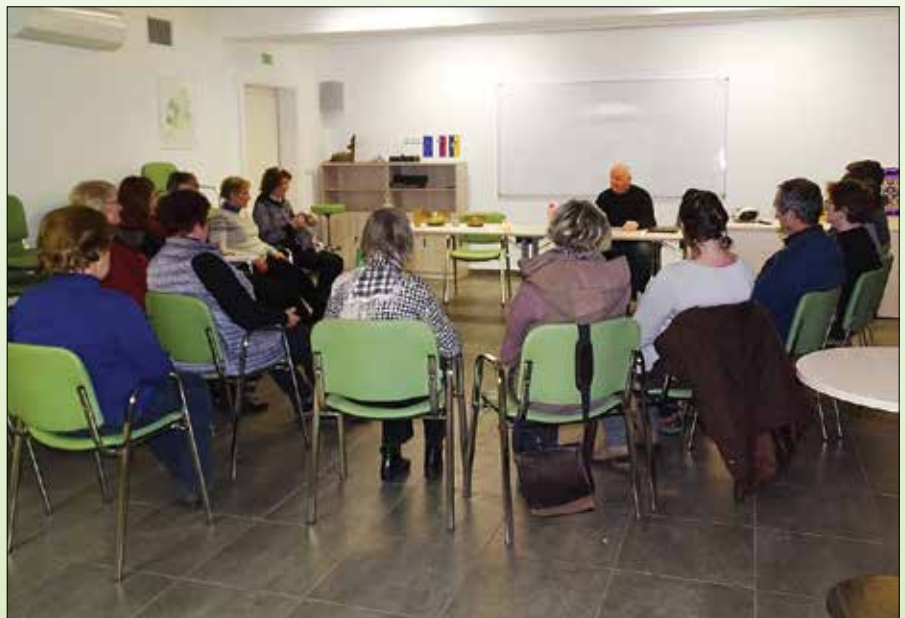
Mesečna druženja so povezana z meditacijo.

Presenetljivo in pohvalno je, da v tej organizirani resnosti in stalnem analitičnem mišljenju iščemo načine, kako spodbujati mehko vsakdanjega življenja. Ključnega pomena