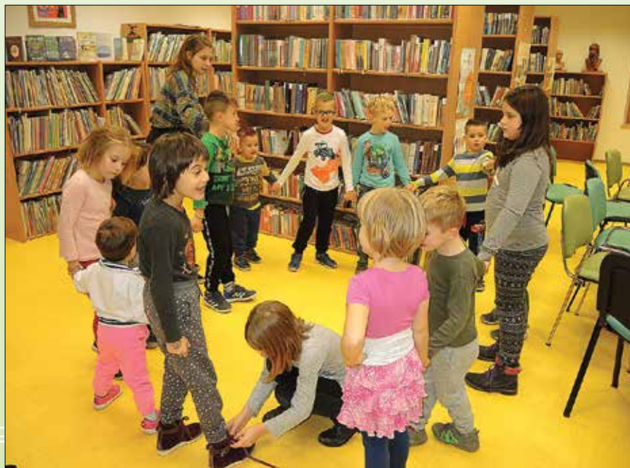
Pravljničarji z veseljem prisluhnejo pravljici in ustvarjajo.

Kot kaže statistika, knjižnico najpogosteje obiskujejo odrasle zaposlene osebe in osnovnošolci, pridni bralci so tudi upokojenci. Letos se lahko v Knjižnici Rečica pohvalimo tudi z izrednim porastom odraslih bralcev, ki so se vključili v projekt bralna značka za odrasle »Zgornjesavinjčani s knjigo v roki«. Minula leta se je skupnemu prebiranju navadno pridružilo manj kot deset bralcev Rečičanov, v lanskem letu je njihovo število prvič na-