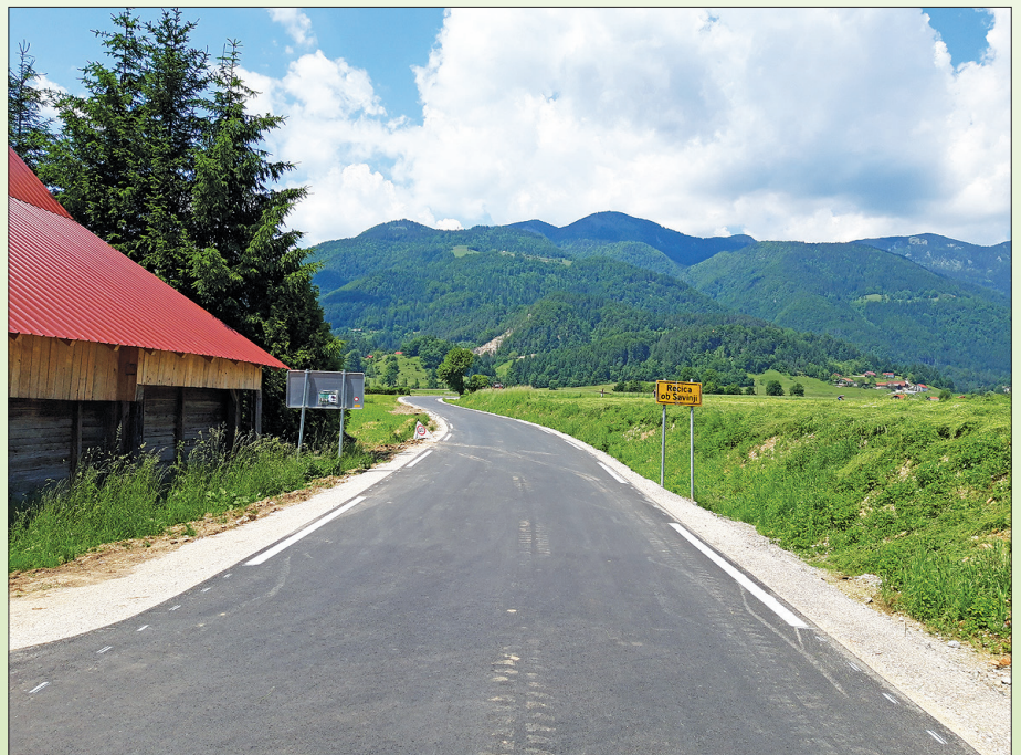
V Poljanah je bilo obnovljenih kar nekaj odsekov ceste.

Že desetletja potekajo prizadevanja, da se usposobi poleg obstoječega vodnega sistema dodatni vodni vir pitne vode. Žegnan studenec je v preteklosti že oskrboval določena naselja v občini, a se je izkazalo, da ni popolnoma zanesljiv. Občina Rečica ob Savinji je skupaj s partnerji pridobila cca 54.000 EUR nepovratnih sredstev za izvedbo raziskav vodnega vira. Z raziskavo se želi preve-