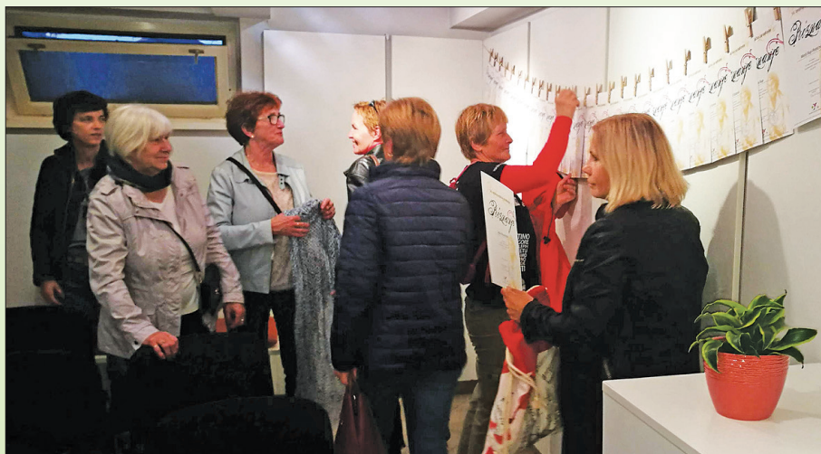
Bralna značka za odrasle

Poudariti je treba, da je dejanskih uporabnikov knjižnice na območju Zgornje