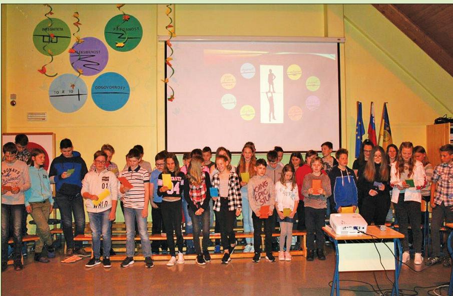
Vrednote so postale del šolskega vsakdana.