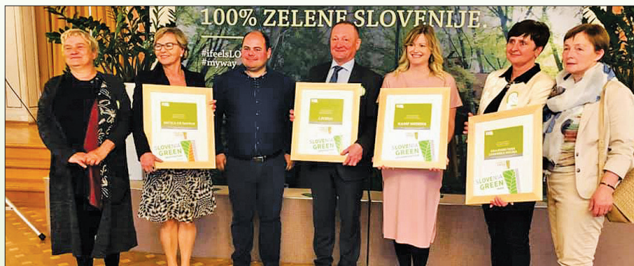
Zgornja Savinjska dolina postaja trajnostna destinacija – zelenim občinam se je poleg Občine Rečica ob Savinji pridružila Občina Ljubno. Logarska dolina je prejela znak za park, Kamp Menina pa za nastanitve.

tovalo od doma, skoraj tretjina pa iz druge destinacije. V času obiska destinacije so tuji gostje največ uporabljali osebni avtomobil, hodili ali kolesarili, podobno pa so odgovarjali tudi domači gostje. Samo 5 % domačih gostov je med obiskom destinacije uporabljalo javni prevoz, pri tujih gostih pa je odstotek še manjši.