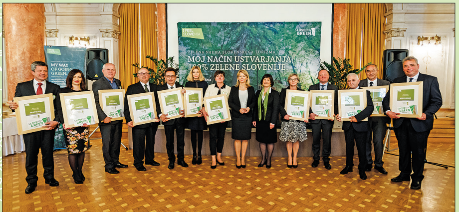
Skupinska fotografija nagrajencev