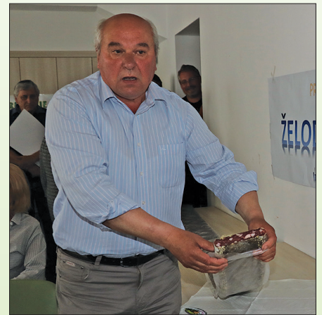
Prezali so tudi 6-metrskega velikana.