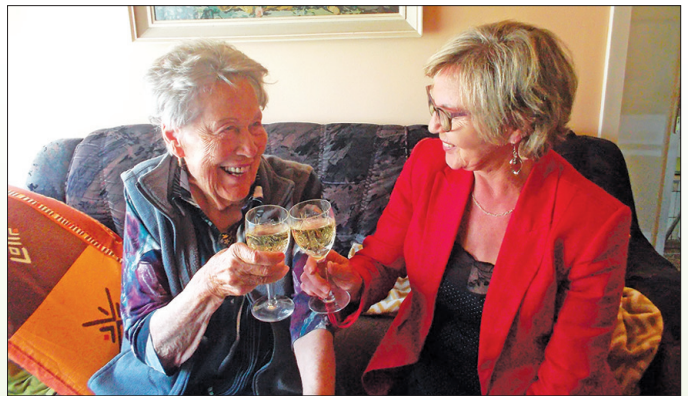
Slavljenska je z veseljem nazdravila z županjo.