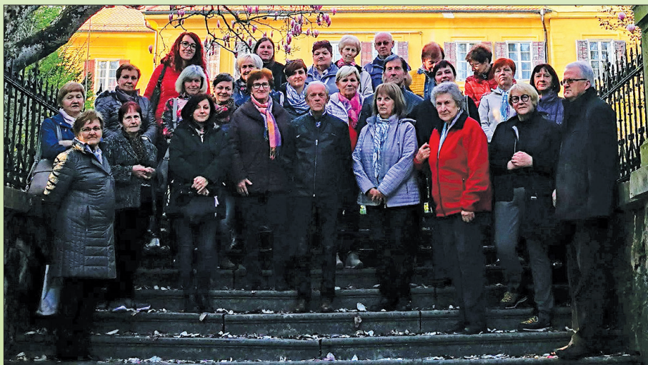
Srečanje bralnih klubov

Savinjske doline bistveno več, po ocenah je okoli 40 odstotkov prebivalcev, ki koristijo storitve knjižnice. Tudi v Knjižnici Rečica našim obiskovalcem nudimo brezplačno uporabo interneta, fotokopiranje ter skeniranje dokumentov, za kar ni potrebna članska izkaznica.