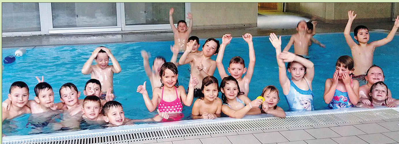
V plavanju so uživali in prav vsi napredovali.

KATJA B.: Všeč mi je bilo, ko smo potopili glavo v vodo in brcali.